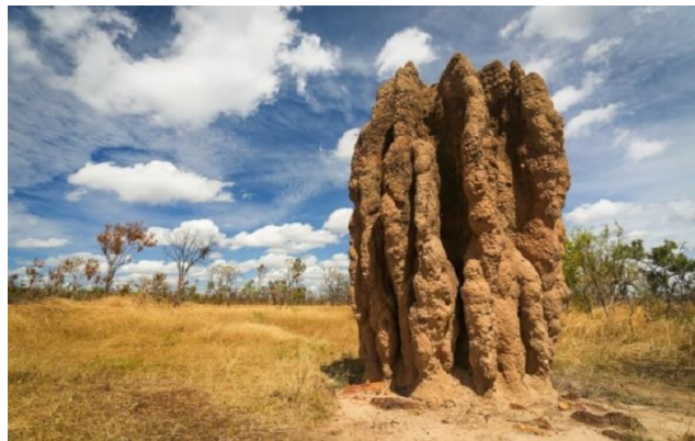
Nido de termitas

Este curso entregará las herramientas teóricas y prácticas para la autoconstrucción considerando técnicas, sectorización y planificación de una estructura de construcción natural.