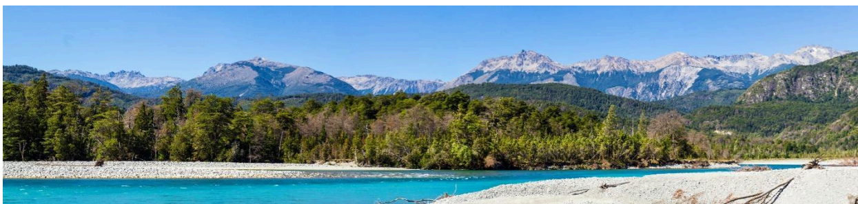
Sector Las Rosas – Río Puelo en la junta con río Ventisquero.